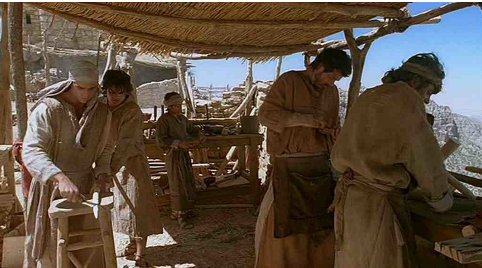
travaux de menuiserie à Nazareth

Pour le portfolio du présent numéro, nous vous offrons quelques photos du téléfilm La Sainte Famille , présenté dans ce numéro. Nous avons notamment été frappé, en visionnant cette œuvre, de retrouver beaucoup des splendides paysages que nous avons admirés ce printemps en Jordanie : le Wadi Rum, Pétra et Dana notamment.