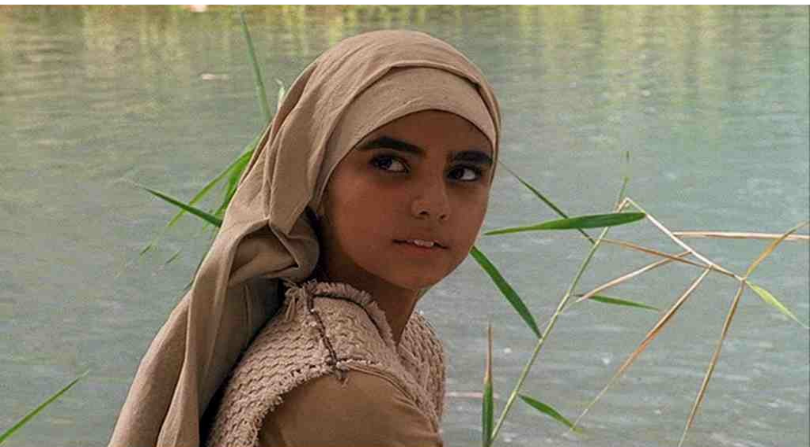
une petite copine de Jésus enfant