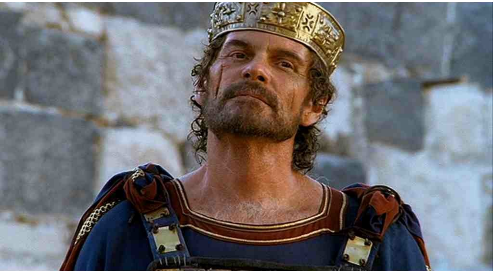
le cruel roi Hérode