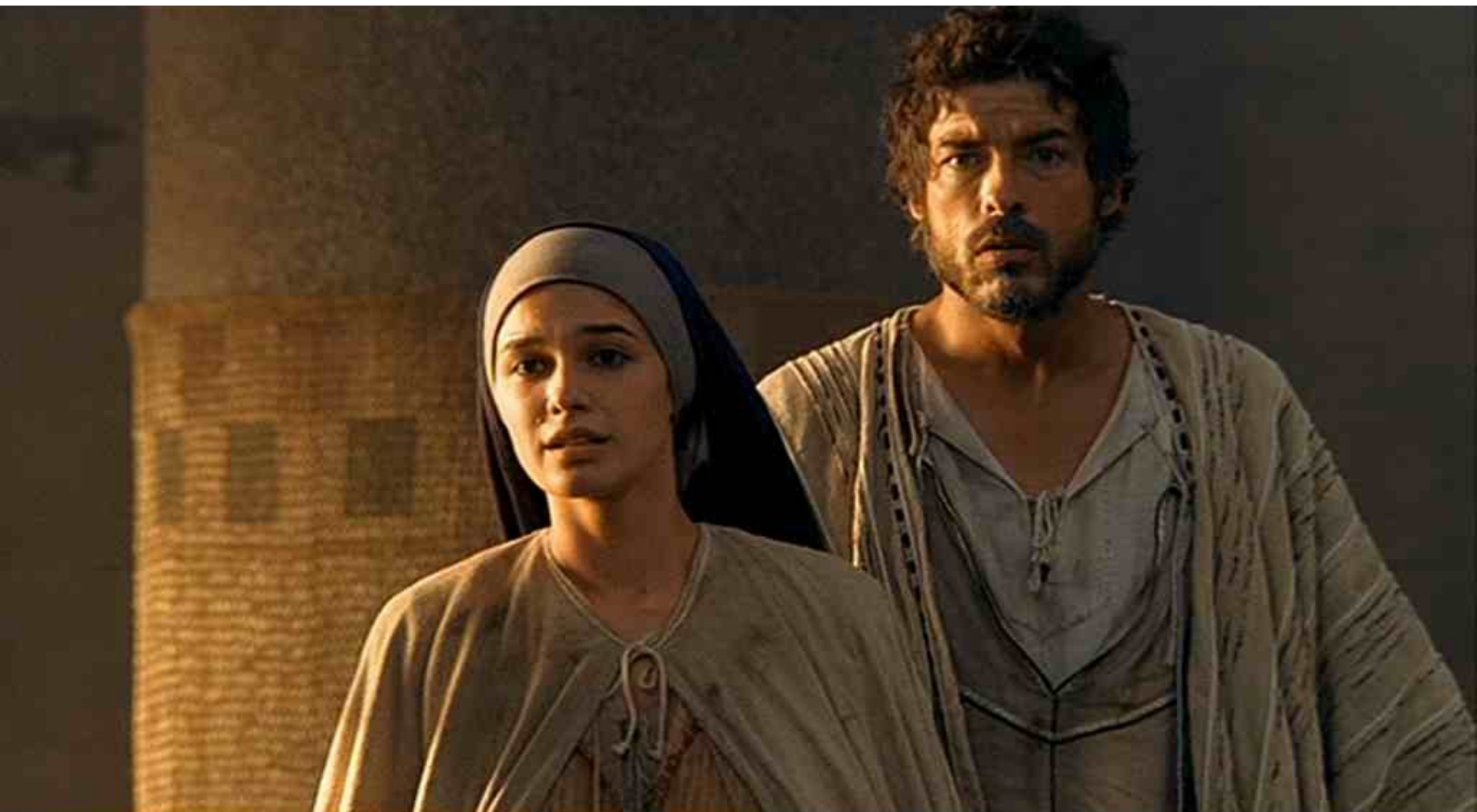
Marie et Joseph