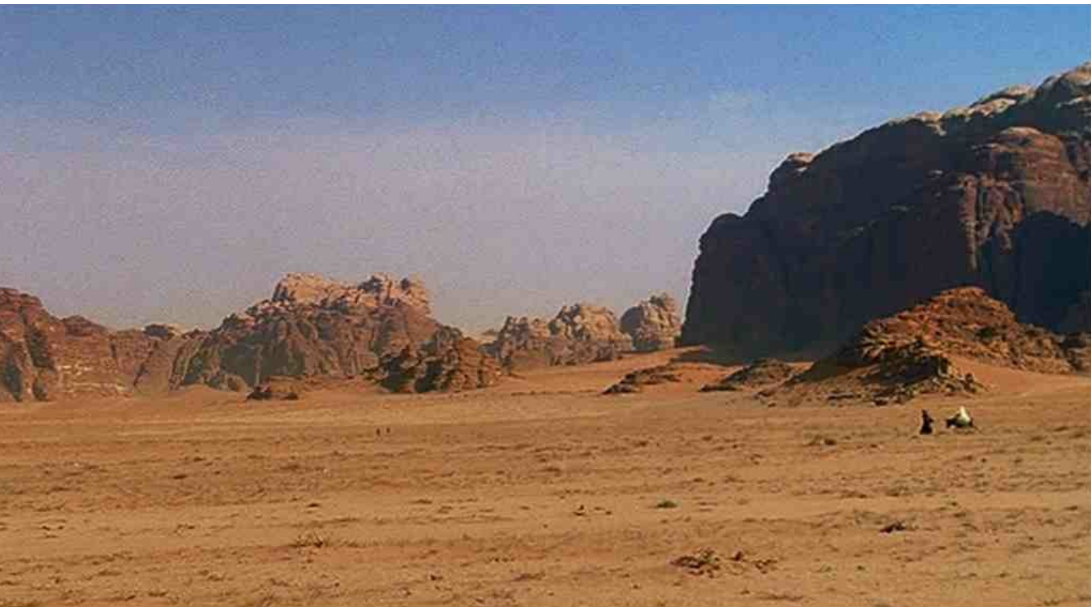
la fuite en Égypte