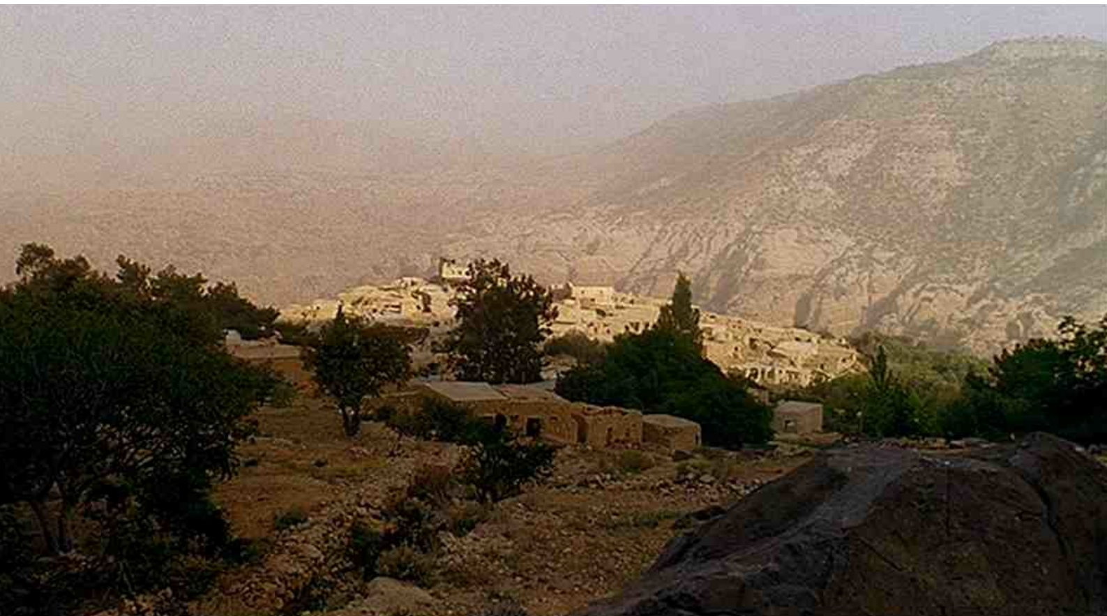
Nazareth (en réalité le merveilleux village jordanien de Dana)