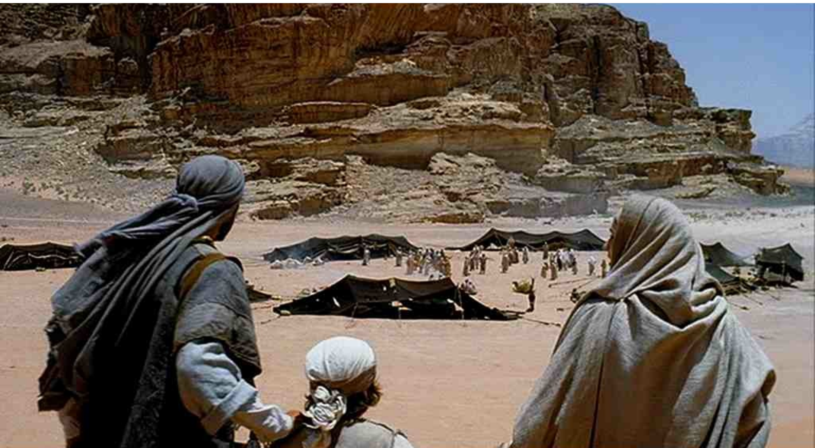
un campement bédouin