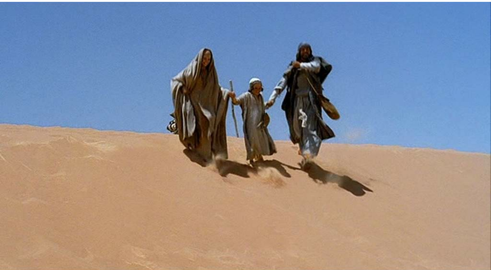
la Sainte Famille franchit une dune