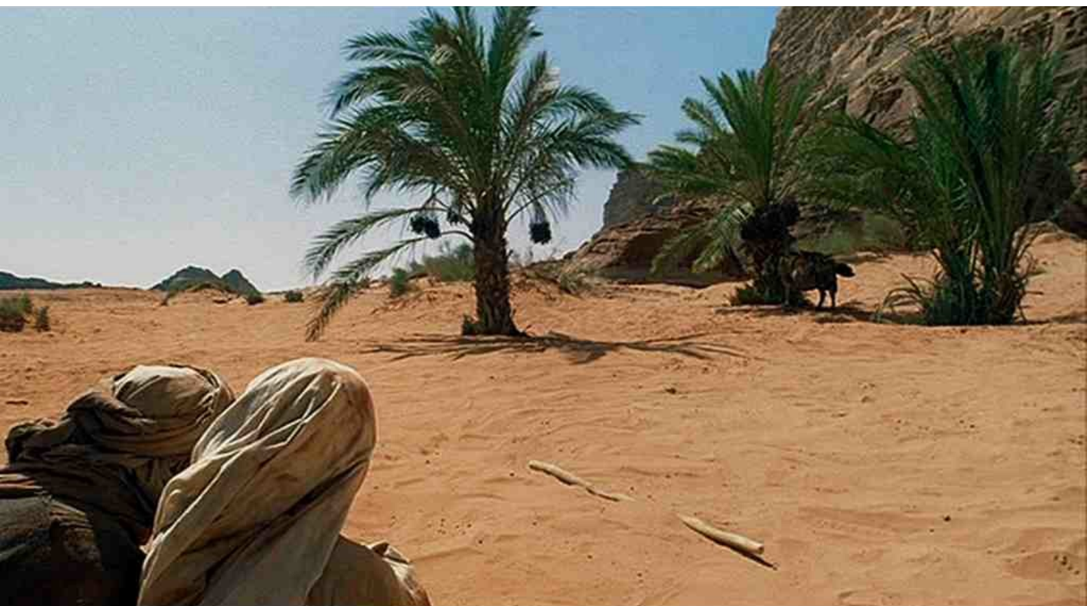
le miracle des palmiers