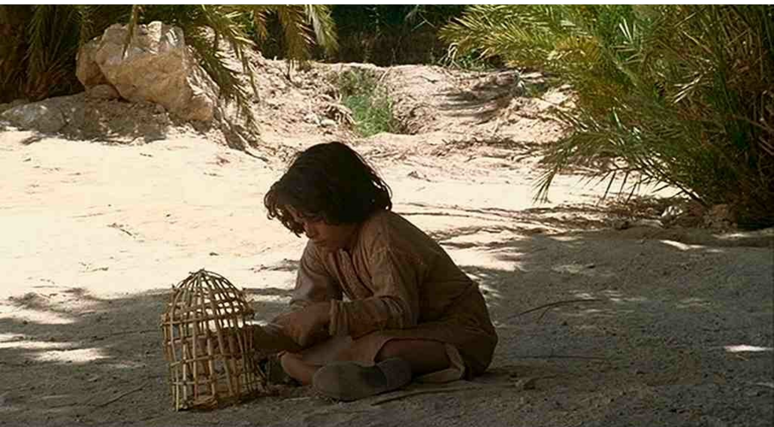
Jésus et l'oiseau