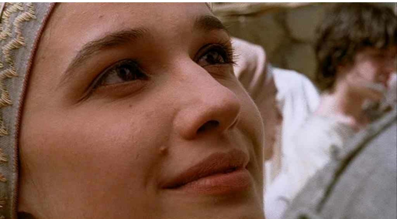
le visage de Marie avec grains de beauté, fossettes et irrégularités