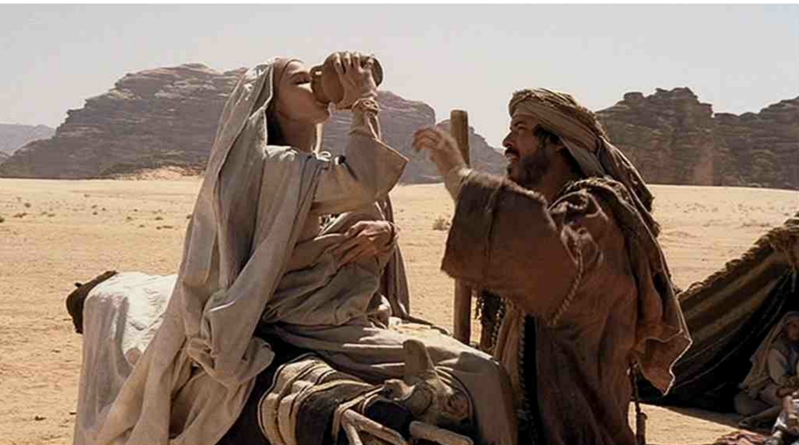
dans le désert (du Wadi Rum)