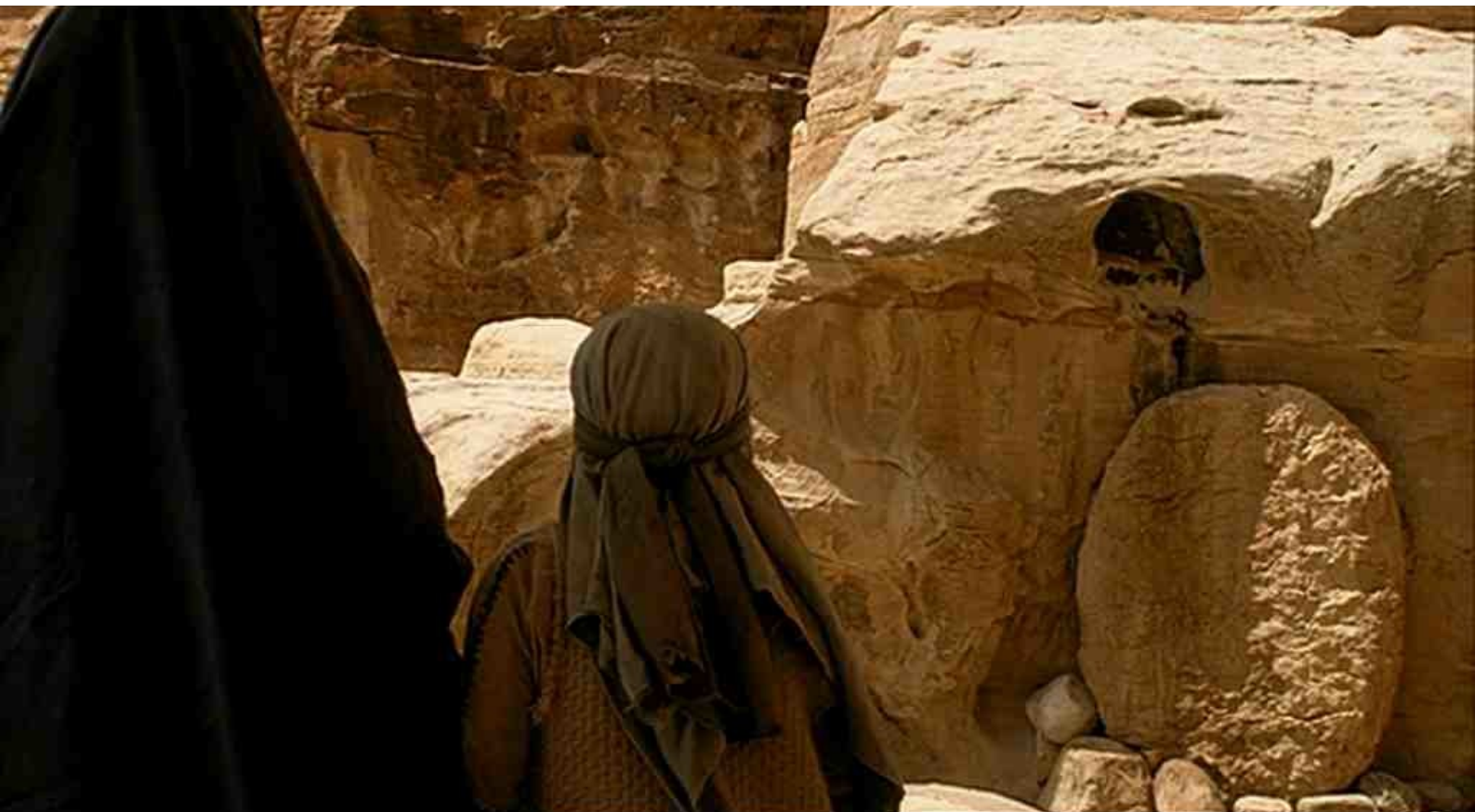
la tombe de Joseph