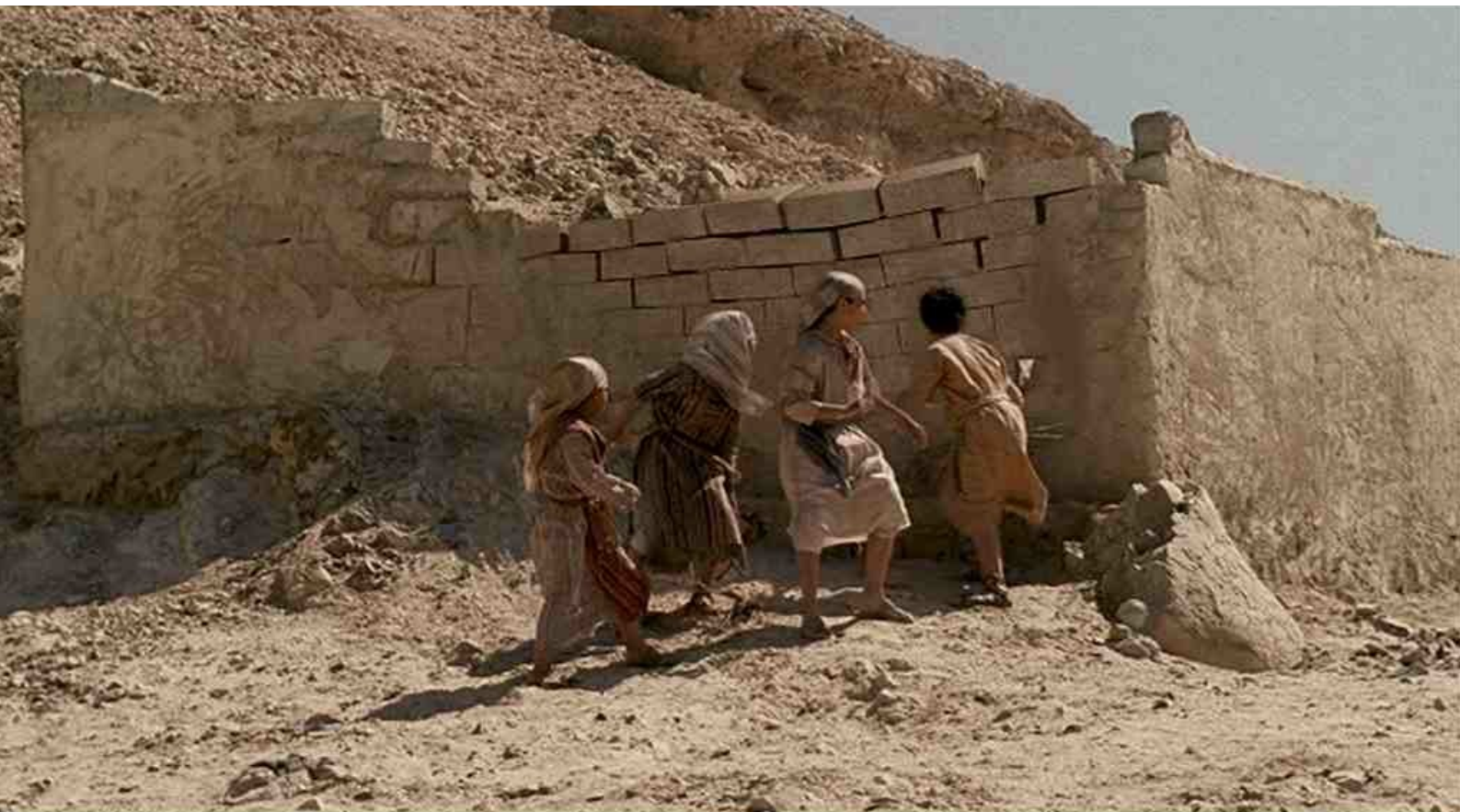
un mur s'effondre sur une bande de petits voyous