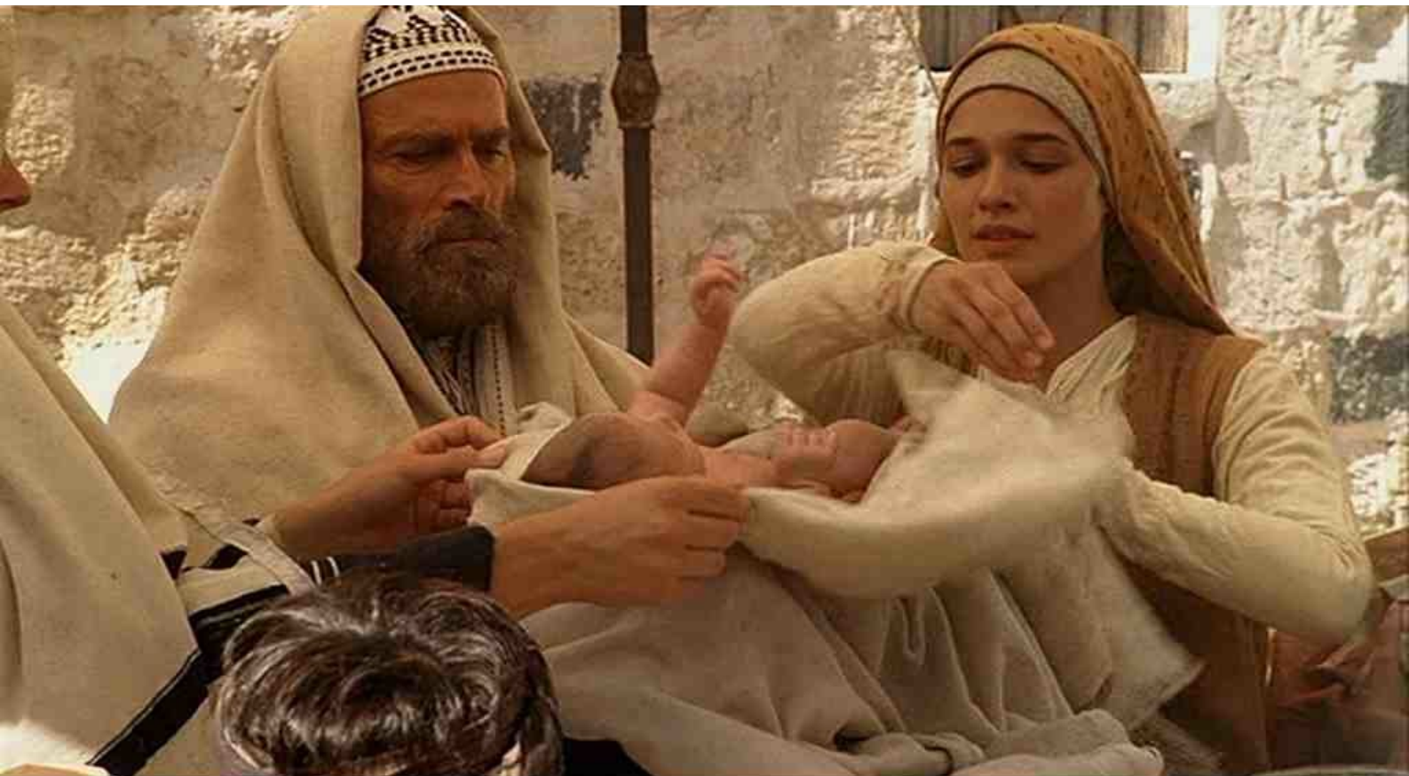
la circoncision de Jésus